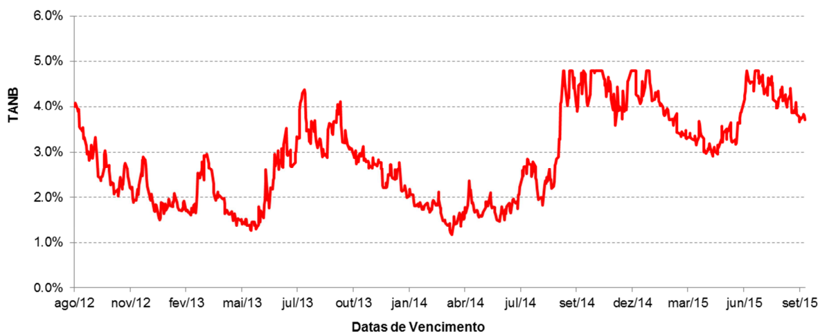
Tabela síntese correspondente à percentagem de observações em que, para Depósitos constituídos entre o dia 16 de Julho de 2009 e o dia 16 de Agosto de 2012 (última data de constituição possível para Depósito a 3 anos e 1 mês e que portanto terminaria a 16 de Setembro de 2015), a TANB teria sido: