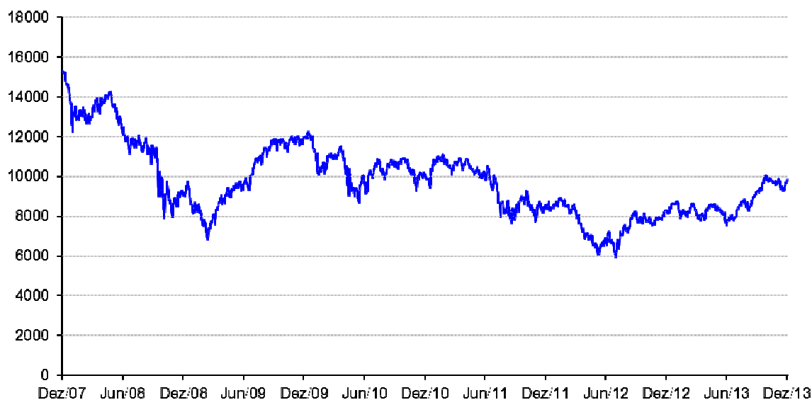
Evolução histórica do Índice de Acções

Nota: gráfico elaborado pelo Banco Santander Totta, S.A., com base nos valores de fecho ajustados obtidos da Bloomberg.