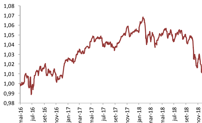
Gráfico de performance – Evolução da UP (€)

No Seguro Financeiro Equilibrado, apesar da volatilidade dos mercados não se realizaram alterações relevantes.