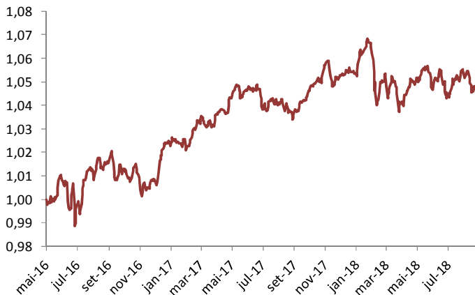
Gráfico de performance – Evolução da UP (€)

No Seguro Financeiro Equilibrado a correção das Bolsas Emergentes foi aproveitada para adicionar uma posição nesta classe à carteira.