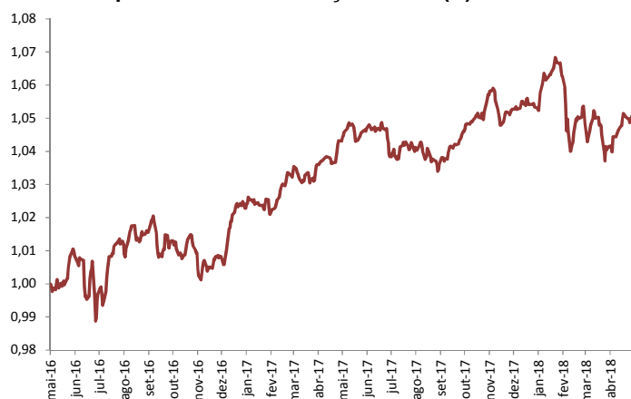
Gráfico de performance – Evolução da UP (€)

Em termos de carteira do Seguro Financeiro Equilibrado, foi realizada a alienação do fundo MAN GLG Flexible Bond, por troca com o reforço no fundo LFIS Vision Premia e compra da obrigação de RENAULT 1% 2024. Na componente acionista não foram realizadas operações.