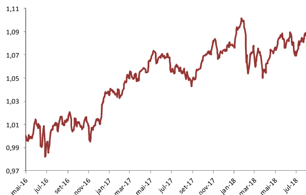
Gráfico de performance – Evolução da UP (€)

Na carteira do Seguro Financeiro Ações Crescimento foi realizada uma troca na carteira direta de ações, saindo Siemens e entrando Airbus, e foi adicionada uma nova posição em CaixaBank.