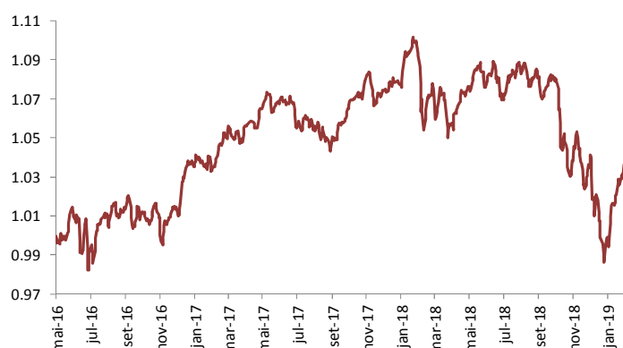
Gráfico de performance – Evolução da UP (€)

No Seguro Financeiro Ações Crescimento, o mês foi aproveitado para alterações estratégicas na carteira de ações e crédito. As posições em High Yield americano e empresas de média dimensão europeias foram vendidas, tendo sido substituídas por grandes capitalizações europeias, empresas que foram muito afetadas com o medo de abrandamento do comércio mundial. Na carteira de ações diretas, a Philips e o CaixaBank foram substituídas por Bureau Veritas e Bankia.