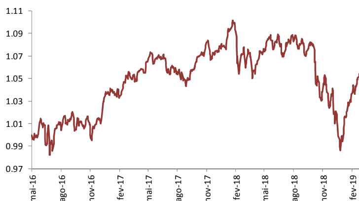
Gráfico de performance – Evolução da UP (€)

No Seguro Financeiro Ações Crescimento, o mês foi aproveitado para uma tomada parcial de mais valias nas posições de EuroStoxx50 e Global Emerging Markets, reduzindo, desta forma, a componente acionista da carteira.