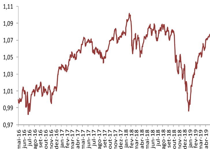
Gráfico de performance – Evolução da UP (€)

No Seguro Financeiro Ações Crescimento realizou-se a compra da espanhola Acerinox.