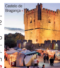
Castelo de Bragança

Feira das Cebolas e Cerâmica: 27 e 28 de agosto, no Monte de Sto Ovídio, Maia . O Museu de História e Etnologia da Terra da Maia recria uma feira com tradição secular. Vários espaços e vivências são retratados. Inserida nas Festas em honra de Santo Ovídio. Das 9h às 23h