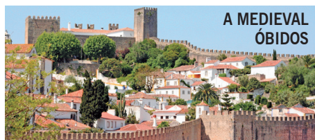
A MEDIEVAL ÓBIDOS